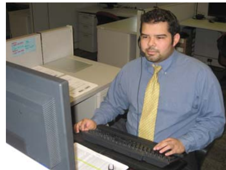
Un Consejero de Opciones está listo para ayudarle.

Antes de llamar, por favor tenga a mano su número de identificación del Medicaid de la Florida ó el número de su tarjeta dorada, el número de su seguro social y la fecha de nacimiento de cada persona que usted vaya a inscribir.