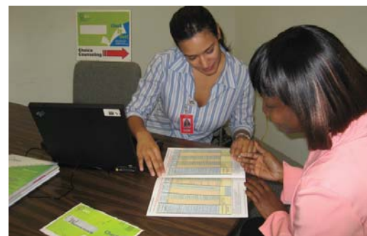
Un Consejero de Opciones se reunirá con usted cuando y donde usted quiera.

Reuniones de grupos de consejería ó entrevista personal de consejería en su área - vea la información en la carta de presentación ó llame a la Consejería de Opciones al 1-866-454-3959 para programar una reunión con un Consejero de Opciones. Si está discapacitado ó no está en condiciones físicas para ir, un Consejero de Opciones le visitará.