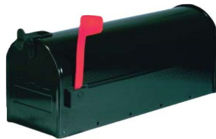
Si usted sabe cuál plan de salud quiere, envíe su formulario hoy.

Si usted sabe cuál plan de salud quiere, llene el formulario de inscripción que está en el paquete y envíelo por correo a la Consejería de Opciones en el sobre provisto. Si se le pierde el sobre puede enviar el formulario a: Florida Medicaid, P.O. Box 5197, Tallahassee, FL 32314-5197.